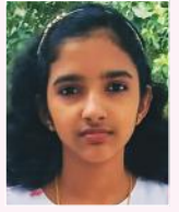
എയ്ഞ്ചൽ തൈസോ ജിൻസ്

7-ാം ക്ലാസ് സെന്റ് സെബാസ്റ്റ്യൻസ് എച്ച്.എസ്.എസ്., കടനാട്