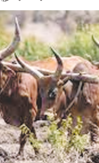
വരുമ്പോൾ കക്ഷിഭേദമന്യേ കടമയുണ്ട്.

ങ്ങളിൽ മുഴങ്ങിയിരുന്നത് വയലുകളെ വരഞ്ഞുകീറിയ കലപ്പുകളുടെയും കാലിക്കുളമ്പടികളുടെയും പൊങ്ങിത്താഴ്ന്ന പണിയായുധങ്ങളുടെയുമൊക്കെ സാരങ്ങളായിരുന്നു. തൊഴിലിനെ ലാളിക്കുന്നവരാണു തൊഴിലാളികൾ. അവരാരും ഒരു പ്രത്യേക പ്രത്യയശാസ്ത്രത്തിന്റെ കണ്ടുപിടിത്തമല്ല. നരന്റെ നിറവും മണ്ണിന്റെ മണവുമാണ് അവർക്കുള്ളത്. അവരുടെ അർഹമായ അവകാശങ്ങളെ അംഗീകരിക്കാനും വിഹിതമായ വേതനം ഉറപ്പുവരുത്താനും അധികാരത്തിൽ