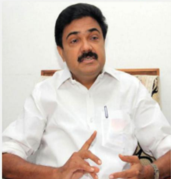
ഡോക്ടർ കെ. മാനി എം. പി.

മണിപ്പൂർ കലാപബാധിതപ്രദേശങ്ങളിൽ തോമസ് ചാഴികാടൻ എം.പി. യോടൊപ്പം സന്ദർശനം നടത്തിയ ജോസ് കെ. മാനി എം. പി. അവിടത്തെ ദുരിതകാഴ്ചകൾ ദീപനാളം വായനക്കാരുമായി പങ്കുവയ്ക്കുന്നു.