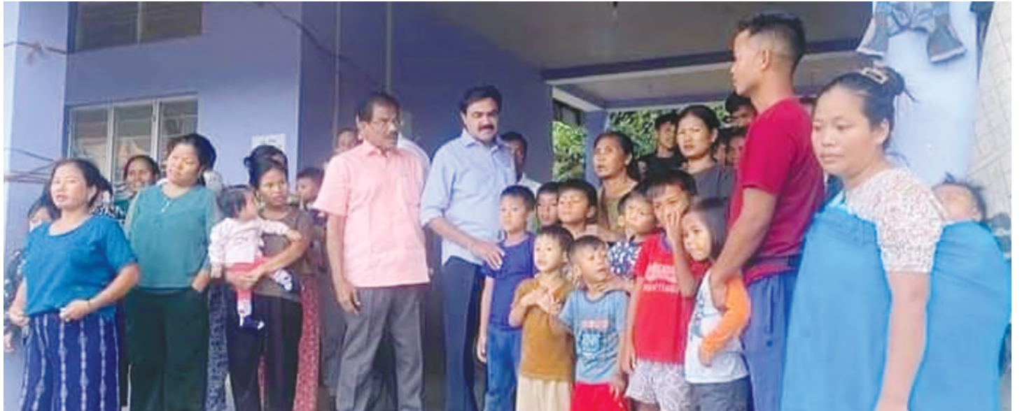
മണിപ്പൂരിലെ വിവിധ ദുരിതാശ്വാസക്യാമ്പുകൾ എം.പി. മാരായ ജോസ് കെ.മാണിയും തോമസ് ചാഴിക്കാടനും സന്ദർശിക്കുന്നു.

പൂർണ്ണമായി തകർക്കപ്പെട്ടു. കാഞ്ചീപോരിലെ ഹോളി റെഡിമർ പള്ളിയുടെ സ്ഥിതിയും ഇതുതന്നെയായിരുന്നു. ഇത്തരത്തിൽ വലുതും ചെറുതുമായ 250 തിലധികം ക്രൈസ്തവാരാധനാലയങ്ങളും സ്ഥാപനങ്ങളും തകർക്കപ്പെട്ടിട്ടുള്ളതായി ഒപ്പം വന്ന പൂരോഹിതർ പറഞ്ഞു. ക്രൈസ്തവർ അധിവസിക്കുന്ന ഗ്രാമങ്ങളെയും ഭവനങ്ങളെയും അവർ നടത്തുന്ന സ്ഥാപനങ്ങളെയും അവരുടെ ഉടമസ്ഥതയിലുള്ള നിർമ്മിതികളെയും പ്രത്യേകം അടയാളപ്പെടുത്തിക്കൊണ്ടുള്ള സമാനരീതിയിലുള്ള തകർക്കൽ പ്രക്രിയയാണ് എവിടെയും നടന്നതെന്ന് പൂരോഹിതർ അടിയറവ്