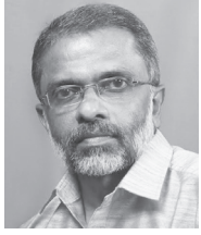
റോം ജോസ് തഴുവംകുന്ന്

“ഹഠലോ അങ്കിളേ... എന്തായി?” “തീർച്ചയായും നീയെത്തണം. പ്രതീക്ഷയില്ലെന്നു