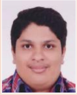
അജയ് കെ. ജോസഫ് കോളജ് ഓഫ് റീച്ചർ എഡ്യൂക്കേഷൻ, കാഞ്ഞിരപ്പള്ളി