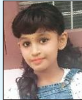
യാന സി. ബി. 6-ാം ക്ലാസ് ഗരിമ വിദ്യാവിഹാർ സ്കൂൾ, ഇൻഡോർ

മാനംപോലും അറിവുനേടാൻ മനുഷ്യർക്ക് ഇതുവരെ സാധിച്ചിട്ടില്ല എന്നതാണു സത്യം. പരിമിതമായ ഇത്തരം അറിവുകളുടെ പിൻബലത്തിൽ, സർവശക്തനായ ദൈവത്തെ അളക്കുന്നത് തികഞ്ഞ ബുദ്ധിശൂന്യതയാണ്. സർവശക്തനായ ദൈവത്തിന്റെ ഭാഷ സന്ദേഹമാണ്. സന്ദേഹമാകുന്ന ചാലകത്തിലൂടെ നമ്മുടെ സഹജീവികളെ അറിയാനും അവരെ മനസ്സിലാക്കാനും നമുക്കു സാധിക്കണം. ജീവിതത്തിന്റെ പ്രതിസന്ധികളെ ഭയക്കുന്ന ഭീരുക്കളുടെ ഈ നൂവടിയല്ല ദൈവഭക്തി; മറിച്ച്, സർവശക്തനായ ദൈവത്തോടു ചേർന്ന്, ഈ ലോകത്തെയും നമ്മുടെ സഹജീവികളെയും നോക്കിക്കാണുന്നതാണ്. ദൈവഭക്തി സമുദ്രപോലെയാണ്. അതിന് അന്തമില്ല. അത് ആഴമുള്ളതാണ്. നമ്മുടെ ജീവിതത്തെ ഉത്തമലക്ഷ്യത്തിലേക്ക് എത്തിക്കാൻ, നേരായ പാതയിൽ നയിക്കാൻ; ദൈവഭക്തി സഹായിക്കുന്നു. മഹാമാരുടെ ജീവിതങ്ങൾ എടുത്തുനോക്കിയാൽ, അവരുടെ ജീവിതത്തിൽ പരിവർത്തനമുണ്ടാക്കുന്നതിൽ ദൈവത്തിലുള്ള അടിയുറച്ച ഭക്തി എത്രമാത്രം സഹായകരമായിട്ടുണ്ടെന്ന് മനസ്സിലാക്കാം. ജീവിതം ഒരു ഓട്ടമത്സരമാണ്. ലക്ഷ്യസ്ഥാനത്ത് എത്തിച്ചേരണം. ജീവിതവിജയം നേടണം. അതിനാൽത്തന്നെ, ദൈവഭക്തിയാകുന്ന ഊർജ്ജം നാം സംഭരിച്ചേ മതിയാകൂ.