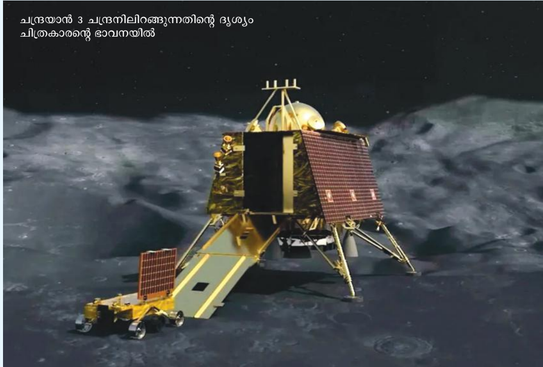
ചന്ദ്രയാൻ 3 ചന്ദ്രനിലിറങ്ങുന്നതിന്റെ ദൃശ്യം ചിത്രകാരന്റെ ഭാവനയിൽ

2020 ൽ ചാങ് ഇ 5-ഉം ചന്ദ്രനിലിറങ്ങി പര്യവേക്ഷണം നടത്തിയ ചൈനീസ് ഉപഗ്രഹങ്ങളാണ്. ഇതുവരെ ചന്ദ്രനിൽ ഉപഗ്രഹം ഇറക്കാൻ കഴിയാതിരുന്ന നമ്മുടെ രാജ്യം, ചന്ദ്രയാൻ 3 ന്റെ ദൗത്യം വിജയിക്കുന്നതോടെ ബഹിരാകാശ ചരിത്രത്തിൽ ഇടം നേടും. 2019 ൽ