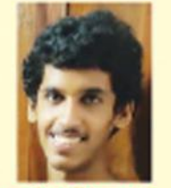
അമിനൻ റഹ്മാൻ നോം വർഷം ബി. കോ. കൂസാറ്റ്

കുറച്ചുനാളായി ദോഗ്രഹഃ എനിക്കൊരാടിനെ വേണം. അടുത്തുള്ള ചന്തയിൽ പോയി അവിടെ കുറെ ആട്ടിൻകുട്ടികളെ വിലപനയ്ക്കു നിരത്തിനിറുത്തിയിട്ടുണ്ട്.