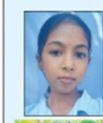
ബേനന്ത റ്റി.വി. 30-ാം ക്ലാസ് ജി.എച്ച്.എസ്.എസ്. മുങ്ങേരി, കണ്ണൂർ

ആരാണെന്ന് സോദരനെന്നു കേൾപ്പൂ. ആദാമിൻ പുത്രനതറിഞ്ഞില്ല എന്താണുണ്ടയെന്നു കേൾപ്പൂ. പന്തിയോസുമതിൻ പൊരുളറിഞ്ഞില്ല. മുളളാണികളിൽപ്പിടഞ്ഞൊരു വളളക്കൊരുടെയരുമഗുരു ചോദിച്ചെന്നൊരുനാൾ ജനത്തോടായ് ചൊല്ലിടു നീയാരെൻ സോദരൻ? ഞാൻ വിതയ്ക്കും വിത്തുകൾ ഞാനൊരുക്കിടുമീ നിലങ്ങളിൽ വീണതു തളിർക്കും പുവിടും നിന്നമണിഞ്ഞൊളിലവനതു ചുംബിക്കും. വചനമാകുമോ വാളെടുത്തു നീ വഞ്ചകനെയുമുലനം ചെയ്യൂ എങ്കിൽ നീ തന്നെയെൻ തായ എനോമൽ സോദരനും നീ താൻ. മണിപ്പുരുമിയകുമവും മാക്കല്ലെയെൻ വാക്കുകൾ നനയ്ക്കല്ലി മിഴികളെ നീ നനച്ചിടുകെൻ വിത്തുകളെ. കൊഴിക്കല്ലെൻ കല്പനകളെ ഒഴിക്കല്ലെന്നുപദേശങ്ങളെ വഴിയുമതുപോൽ ജീവനും സത്യവുമി ഞാൻതന്നെയല്ലയോ. നിലവിളിക്കുന്നവരി മണ്ണിൽ നിന്നഗന്ധമുള്ള ശരീരങ്ങൾ പാലിക്കു നീയിനിയെങ്കിലുമി പാലകനാമെൻ വചസ്സുകളെന്നും. മടിക്കല്ലെയെൻ പ്രിയമകനെ മിടിക്കുമെൻ വചനങ്ങൾ കാക്കാൻ മടിക്കുത്തഴിക്കുമി നരായമർ അടിച്ചിടുന്നെന്നെയിന്നുമേ. ഇനി നിയെന്നമുതസോദരൻ കനിഞ്ഞിടും ഞാനെന്നും നിന്നിൽ എൻ പ്രിയമതാവും നീ താൻ എൻ വചസ്സുകൾ പാലിക്ക നിയെന്നും.