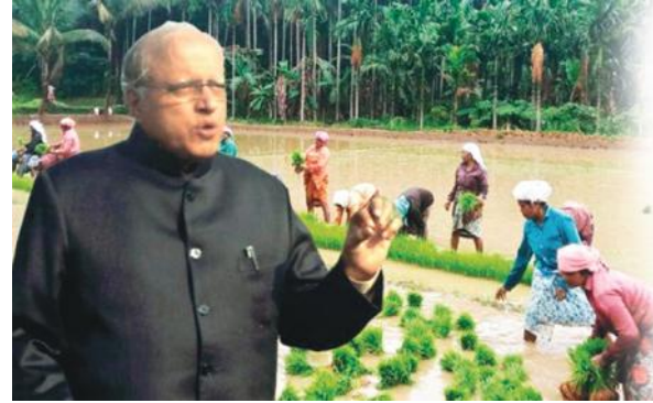
3-ാം പേജ് തുടർച്ച