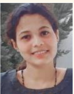
സുര്യ സന്തോഷ് ജി.ജി.എസ്.എം. നേഴ്സിങ്ങ് സ്കൂൾ, മൈസൂർ

കൊച്ചു കുട്ടികൾ മുതൽ മുതിർന്നവരെ ഇന്ന് ലഹരി മരുന്നിന്റെ പിടിയിലാണ്. ആധുനികത ലഭ്യമായ നേരിടുന്ന ഏറ്റവും വലിയ വെല്ലുവിളിയായിരിക്കുന്നു. ലഹരി മാഫിയയുടെ