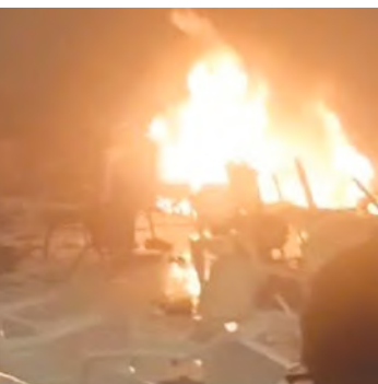
2023 ഒക്ടോബർ 29ന് കളമശേരി സാമ്രമാ കൺവൻഷൻ സെന്ററില്യുണ്ടായ സഹോദര കലാപങ്ങൾ

സിമിയുടെ പരിശീലനക്യാമ്പുകൾ കേരളത്തിൽ പല ഭാഗങ്ങളിലും നടന്നതായി റിപ്പോർട്ടുകളുണ്ടായിരുന്നു. പാനായിക്കുളം, വാഗമൺ എന്നിവിടങ്ങളിൽ നടന്ന രഹസ്യക്യാമ്പുകളിൽ പരിശീലനം ലഭിച്ചവർ രാജ്യ