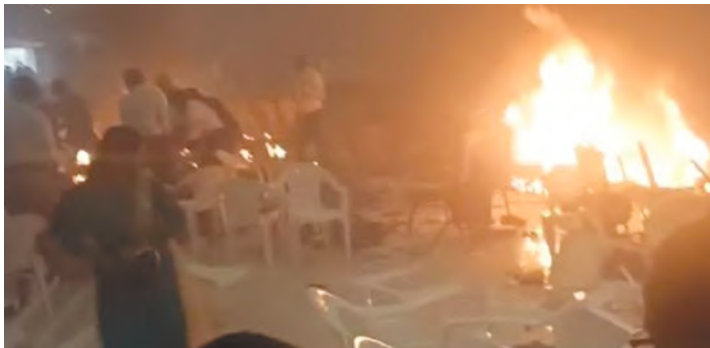
2023 ഒക്ടോബർ 29ന് കളമശേരി സാമ്രമാ കൺവൻഷൻ സെന്ററില്യുണ്ടായ സഹോദര കലാപങ്ങൾ

1980 കളിൽ നിരോധിത സംഘടനയായ 'സിമി'യുടെയും മറ്റു ചില തീവ്രവാദസംഘടനകളുടെയും പ്രവർത്തനമെന്നു ചൂണ്ടിക്കാട്ടപ്പെട്ട സംഭവങ്ങൾ കേരളത്തിലുണ്ടായിരുന്നു. മലബാറിൽ ഓലമേഞ്ഞ സിനിമാ