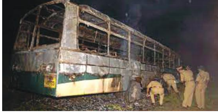
2005 സെപ്റ്റംബർ ഒമ്പതിനു രാത്രിയിൽ കളമശേരിയിൽ കത്തിച്ച തമിഴ് നാട് ട്രാൻസ്പോർട്ട് കോർപ്പറേഷന്റെ ബസ്.

ഗവേഷകരുടെ ചിന്തയെങ്കിലും അവരെ ഞെട്ടിച്ചുകൊണ്ട് പുതിയ തെളിവുകൾ കണ്ടെത്തിയിരിക്കുന്നു. എലികളുടെ ശരീരത്തിൽ കണ്ടെത്തിയതുപോലെ അടുത്തിടെ മനുഷ്യന്റെ രക്തത്തിലും വേർതിരിച്ചെടുക്കാനാവാത്തവിധത്തിൽ പ്ലാസ്റ്റിക് കണങ്ങൾ കണ്ടെത്തി; അതും പരീക്ഷിച്ച 80 ശതമാനം ആളുകളിലും. രക്തചംക്രമണവ്യവസ്ഥയിൽ, പ്രത്യേകിച്ച് മസ്തിഷ്കവ്യവസ്ഥയിൽ പല ആഘാതങ്ങൾക്കും ഇവയുടെ രക്തത്തിലെ അളവും നീക്കവും കാരണമായേക്കാമെന്നു ഗവേഷകർ കരുതുന്നു. രക്തത്തിലൂടെ കരൾ, മസ്തിഷ്കം, ഹൃദയം തുടങ്ങി പല ആന്തരാവയവങ്ങളിലും അവ ജീവതകാലം മുഴുവനും നീക്കപ്പെടാതെ നിക്ഷേപിക്കപ്പെടുന്നു. പൊതുവെ, ശരീരത്തിന് ആവശ്യകമായ മൂലകങ്ങൾപോലും വേണ്ട അളവിൽ കൂടുതലാണെങ്കിൽ പുറംതള്ളുകയാണു ശരീരധർമ്മം. അല്ലെങ്കിൽ അവ കോശനാശവും അതുവഴി രോഗാവസ്ഥകളും സൃഷ്ടിക്കും. നിർഭാഗ്യവശാൽ ശരീരത്തിന് അരിച്ചുകളയാൻ സാധ്യമല്ലാത്തവിധം വിനാശകാരികളായി പ്ലാസ്റ്റിക് കണങ്ങൾ ശരീരത്തിൽ നിക്ഷേപിക്കപ്പെടുന്നു. ഓരോ വർഷവും ഏകദേശം നാനൂറു ദശലക്ഷം ടൺ പ്ലാസ്റ്റിക് ഉൽപാദിപ്പിക്കപ്പെടുന്നു. 2050 ആകുമ്പോഴേക്കും ഇത് ഇരട്ടിയിലധികമാകും. എല്ലാത്തരം പ്ലാസ്റ്റിക്കുകളുടെ ഉൽപാദനവും ഉടൻ നിർത്തിയാൽപ്പോലും നിലവിലുള്ള പ്ലാസ്റ്റിക്തന്നെ ഏകദേശം അഞ്ചു ബില്യൺ ടൺ കാണുമെന്നു കരുതപ്പെടുന്നു. നോബലിനോടൊപ്പം വൃത്തിയാക്കാൻ കഴിയാത്ത ചെറിയ ശകലങ്ങളായി അവ ജീവജാലങ്ങൾക്കു ഭീഷണിയായി നിലനിൽക്കും. ജൈവശൃംഖലയുടെ ഉപാപചയപ്രവർത്തനങ്ങളിൽ ഒരു പങ്കാളിത്തവുമില്ലാത്ത പ്ലാസ്റ്റിക് മാലിന്യങ്ങൾ ഉണ്ടാക്കാൻപോകുന്ന ആരോഗ്യ - പരിസ്ഥിതി പ്രശ്നങ്ങൾ നമ്മുടെ ചിന്തയ്ക്കു പുറമാണ്. വരുംകാലങ്ങളിൽ പ്ലാസ്റ്റിക് മനുഷ്യകുലത്തിനുമത്രമല്ല, ജൈവകുലത്തിന് ഒന്നാകെത്തന്നെ ഒരു ടൈംബോംബായി മാറും, സംശയിക്കേണ്ട.