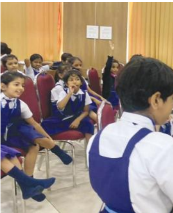
ഒളല്ലാം ദൈവമക്കളാണെന്ന അവബോധം എത്ര സുന്ദരമാണ്!

അതേ, കുഞ്ഞുങ്ങളെല്ലാം ദൈവത്തിന്റേതാണ് (ഖലിൽ ജിബ്രാൻ). ഈശ്വരചിന്തയും ഈശ്വരപ്രാർത്ഥനയും ഈശ്വരവിശ്വാസവും വിദ്യാഭ്യാസത്തിന്റെ അടിത്തറയായി നിലകൊള്ളേണ്ടതുതന്നെയാണല്ലോ. മനുഷ്യമക്ക