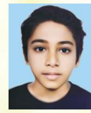
ആദിദേവ് എസ്. ഗവ. യു.പി. സ്കൂൾ തലാപ്, കണ്ണൂർ

വ്യക്തിത്വവും സാമൂഹിക ബോധവും ജ്ഞാനതൃഷ്ണയും രൂപപ്പെടേണ്ട കലാലയങ്ങൾ ഇന്നു ഹിംസാത്മകമാവുകയാണ്. ആൺ - പെൺ സൗഹൃദങ്ങൾ പണ്ടുപതിവായിരുന്നെങ്കിലും പ്രണയത്തെ ഇന്നത്തെപ്പോലെ ഭയക്കേണ്ടതില്ലായിരുന്നു. കൊതിച്ചതു കിട്ടിയില്ലെങ്കിൽ തട്ടിപ്പറിച്ചു നിലത്തിട്ട് ചവിട്ടിയരയ്ക്കുന്ന മാനസികാവസ്ഥയിലേക്ക് കൗമാരക്കാരുടെയും യുവജനങ്ങളുടെയും മനസ്സു ചുരുങ്ങുമ്പോഴാണ് ക്രൂരമായ പ്രതികാരപ്രവൃത്തികളുണ്ടാവുന്നത്. പ്രണയാഭ്യർഥന