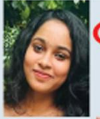
രൈശ എം. പത്താം ക്ലാസ് ക്ലാസി സിനിമർ സൈക്കിൾ സ്മരണാശേരി

ഇവെപ്പകലിപ്പുറം ചുമന്നെത്തിച്ച് നിറച്ച പഞ്ഞായം സന്ദേശം മറന്ന് വിദേശം കാണാൻ പോയ മനുഷ്യർ കൃത്തിത്തുണനതറിയൊതെ അവൻ നിസ്സഹായനായി. ബ്ലേഡുമാനകളിൽ മുറിഞ്ഞ ഹൃദയവുമായി അവസാനപറ്റിൽ ‘എലി’വിഷം കലർത്തി. ആ കണ്ണുകളിൽ ദീനത കവിഞ്ഞൊഴുകി. തട്ടിൻപുറത്തെ ചിത്തുനാരിയ ആ ശവങ്ങൾ ദുർഗന്ധം കാറ്റിൽ പരത്തി. കാറ്റ് അതു കൈമാറി വിശി. ഹെഡ്മാസ്റ്റർ ചുരലെടുക്കാൻ കൂട്ടികളെ പഠിപ്പിച്ചു.