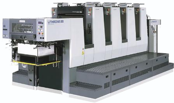
മൾട്ടി കളർ പ്രിന്റിങ് മെഷീൻ