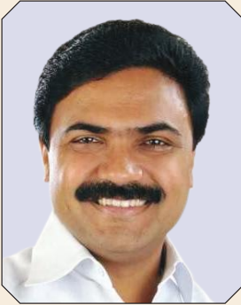
ജോസ് കെ. മാണി എം.പി.