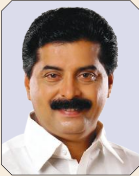
നോഷി അഗസ്റ്റിൻ ജലവിഭവവകുപ്പുമന്ത്രി