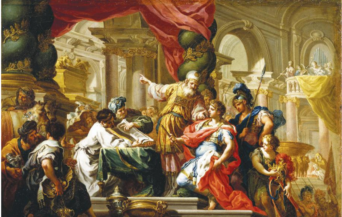
മഹാനായ അലക്സാണ്ടർ ജറുസലേമിലെ പ്രധാന പുരോഹിതനോപ്പം

‘അത് അവന്റെ സന്താനങ്ങൾക്കു ലഭിക്കുകയില്ല’ എന്ന വചനം യാഥാർത്ഥ്യമാകുമാറ് അലക്സാണ്ടറിന്റെ പ്രധാന സേനാധിപന്മാരായ കസ്സാണ്ടർ, ടോളമി, ആന്റിഗോണസ്, സെല്യൂക്കസ് എന്നിവർ യഥാക്രമം മാസിഡോണിയ, ഈജിപ്ത്, ഏഷ്യാമൈനർ, മധ്യേഷ്യ എന്നിവിടങ്ങളിൽ ഭരണാധികാരികളായി. ചക്രവർത്തിയുടെ മരണസമയത്ത് സന്താനങ്ങൾ ജനിച്ചില്ലാതിരുന്നത് നാലു സേനാധിപന്മാരെയും പെർഡിക്കാസിനെയും കൂഴക്കി. പിന്നീട്, ബാക്ട്രിയ (ഇപ്പോഴത്തെ താജിക്കിസ്ഥാൻ പ്രദേശം) സ്വദേശിനിയായ ഭാര്യ റൊക്സാനയിൽ ജനിച്ച അലക്സാണ്ടർ നാലാമനെയും അവന്റെ അമ്മയെയും കസ്സാണ്ടർ മാസിഡോണിയയിലേക്കു വിളിച്ചുവരുത്തി തടവിലാക്കുകയും, ബി സി 309 ൽ കൊലപ്പെടുത്തുകയുമായിരുന്നു. റീജന്റായി സേവനം ചെയ്തിരുന്ന വിശ്വസ്തനായ പെർഡിക്കാസിനെ നേരത്തേ തന്നെ ഇല്ലായ്മ ചെയ്തിരുന്നു.