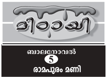
ബാലനോവൽ 5 രാമപുരം മണി

31 നു മുൻപ് ഇന്ത്യയിൽ സ്ഥിരതാമസമാക്കിയവരുമായിരിക്കണം. ഈ നിയമത്തെ എതിർക്കുന്നത് പ്രധാനമായും മുസ്ലീം സഹോദരങ്ങളും ബിജെപി വിരുദ്ധകക്ഷികളുമാണ്. കോൺഗ്രസും ഇടതുപക്ഷപ്രസ്ഥാനങ്ങളും പ്രത്യക്ഷസമരങ്ങളിൽ ഇടപെടാതിരിക്കുന്നതു ഹൈന്ദവവോട്ടുകൾ നഷ്ടപ്പെടാതിരിക്കുന്നതിനുവേണ്ടിയാണെന്നു വ്യക്തം. മതത്തിന്റെ പേരിൽ പൗരത്വം നിശ്ചയിക്കുന്നത് ഭരണഘടനയുടെ 14-ാം അനുച്ഛേദത്തിനെതിരായതാണ് പൗരത്വഭേദഗതിനിയമത്തിനെതിരായ പ്രധാന ആക്ഷേപം. ഇതു മുസ്ലീം വിരുദ്ധനിയമമാണെന്ന വിമർശനവുമുണ്ട്. ഇന്ത്യയുടെ മതനിരപേക്ഷതാ സങ്കാരത്തിനെതിരാണ് ഈ നിയമമെന്ന വിശ്വാസം ശക്തമാണ്.