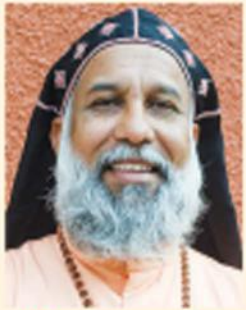
കർദിനാൾ ബസേലിയോസ് മാർ ക്രിമിസ് ബാവ

യേശുവിന്റെ കല്ലറയിൽ നിന്ന് ഉരുട്ടിമാറ്റിയിരിക്കുന്ന കല്ലിന് (വി. ലൂക്കോ 24:2) വലിയ സൂചനയാണ്. ഭാരമുള്ള ഒരു കല്ലിന്റെ ബലത്തിൽ യേശു ക്രിസ്തുവിന്റെ നിത്യതയിലേക്കു നീളുന്ന ജീവിതത്തെ തളച്ചിടാമെന്നു കരുതിയവർക്കു തെറ്റുപറ്റി. ഏതു ഭാരമുള്ള പാറയും സിംഹിതമാക്കുന്ന പാളികളും അവന്റെ ജീവശ്വാസത്തിനുമുമ്പിൽ വഴിമാറും. കാവൽപ്പടയാളികളുടെ ആയുധങ്ങളും സംരക്ഷണകവചങ്ങളും അവന്റെ മുമ്പിൽ നില്പാതിക്കും. തുറന്നുകിടക്കുന്ന കല്ലറ സൂചിപ്പിക്കുന്ന ചില യാഥാർത്ഥ്യങ്ങളുണ്ട്. നഷ്ടപ്പെട്ടുപോയി എന്നും എന്നെന്നേക്കുമായി കൈവിട്ടുപോയി എന്നും കരുതുന്നതിനെ തിരികെനൽകാൻ ഉയിർത്തെഴുന്നേറ്റു നിൽക്കുവാൻ കഴിയുമെന്ന് ഉറപ്പുനൽകുന്ന വസ്തുതയാണ് ഇവിടെ സൂചിപ്പിച്ചിരിക്കുന്ന യാഥാർത്ഥ്യം. അടഞ്ഞുപോയ വാതിലുകളെന്ന് നിരാശയോടെ നോക്കിനിൽക്കുന്ന കാഴ്ചകളും ജീവിതത്തിന്റെ സങ്കടവഴികൾക്ക് ഉന്മിതനായ കർത്താവു നൽകുന്ന ഉത്തരവും തുറന്നുകിടക്കുന്ന കല്ലറയെ കൂടുതൽ ജീവിതഗന്ധിയാക്കുകയാണ്.