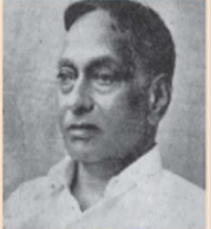
താഴെപ്പറഞ്ഞ പ്രിന്സിപ്പൽ വൈദ്യൻ (പി. ഒ. കിത്ത്)

പി. ഒ. മേവ്സ്, കോട്ടയം - 686573 PH: 04822 - 269155, Mob: 9400869155 (വൈദ്യശാല)