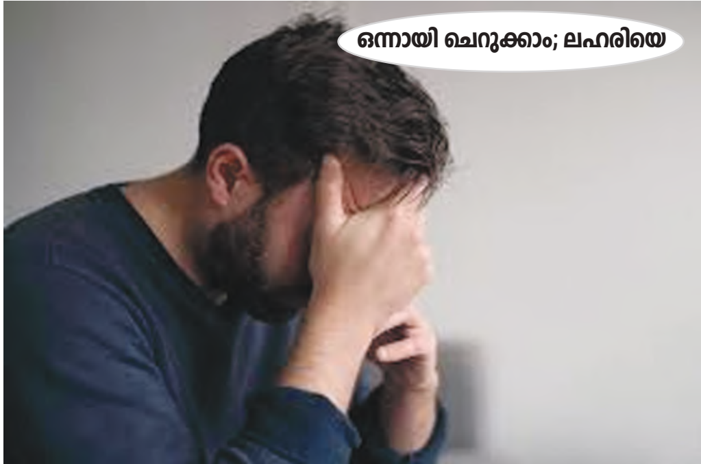
ഒന്നായി ചെറുക്കാം; ലഹരിയെ

മണിചെയിൻ മാതൃകയിൽ കേരളത്തിൽ ലഹരിവില്പന വ്യാപിക്കുന്നതായി കേന്ദ്ര ലഹരിവിരുദ്ധ ഏജൻസിയായ നാർകോട്ടിക് കൺട്രോൾ ബ്യൂറോയുടെ ഇന്റലിജൻസ് വിഭാഗം റിപ്പോർട്ട് ചെയ്തിട്ടുണ്ട്. അതീവശുരുതരമായ ഈ സാമൂഹികപ്രശ്നത്തെ ഇനിയും കണ്ടില്ലെന്നു നടിച്ചാൽ നമുക്കു നഷ്ടമാകുന്നത് ഒരു തലമുറയെയാവും. പോലീസും എക്സൈസും സമാഹൃത വിചാരിച്ചാൽ തടയാവുന്നതിനപ്പുറമാണ് ലഹരിമാഫിയായുടെ വ്യാപ്തി. എല്ലാ സംവിധാനങ്ങളെയും ഒരുമിച്ച് അണിനിരത്തി പ്രത്യേക കർമ്മ പദ്ധതി തന്നെ ആവിഷ്കരിക്കണം. രക്ഷിതാക്കൾക്കും യുവജനപ്രസ്ഥാനങ്ങൾക്കും പൊതുജനത്തിനും ഇതിൽ വലിയ പങ്കുവഹിക്കാനുണ്ട്. ലഹരിയിലേക്ക് ഒഴുകിത്തീരാനുള്ളതല്ല പുതുതലമുറയെന്ന നിശ്ചയദാർഢ്യത്തോടെ നമുക്കു മുന്നോട്ടു നീങ്ങാം. കൂടുംബാത്മരക്ഷത്തിലെ ശാന്തിയും തുറന്ന അഭിപ്രായവിനിമയങ്ങളും കുട്ടികൾക്കു നൽകുന്ന സ്നേഹസമൃദ്ധമായ കരുതലും അവരെ മോശമായ വഴികളിൽനിന്ന് പിന്തിരിപ്പിക്കും. നമ്മുടെ മക്കളുടെ ഭാവിയുടെ താക്കോൽ, രക്ഷിതാക്കളുടെയും അധ്യാപകരുടെയും സർക്കാരിന്റെയും കയ്യിലാണ്.