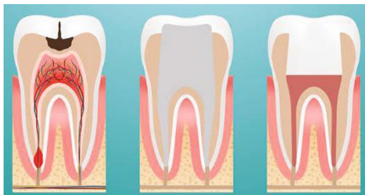
Infected Tooth Tooth Cleaned and Shaped Root Filling and Crown Replaced

ളിലേക്കു ചെല്ലുന്ന ന്യൂറോവാസ്കുലാർ ബണ്ടിൽ ഈ കനാലിലൂടെയാണു സഞ്ചരിക്കുന്നത്. ഇതിനെ പൾപ്പ് എന്നു വിളിക്കുന്നു. ഒരു പല്ലിനെ നടുവെ മുറിച്ചാൽ നമുക്കു കാണാൻ സാധിക്കുക ആദ്യം പുറമേയുള്ള ഇനാമൽ. തൊട്ടുതാഴെ ഡെന്റിൻ. അതിനുശേഷം പല്ലിന്റെ കനാലിൽ കാണുന്നത് പൾപ്പാണ്. ഈ പൾപ്പ് എടുത്തു കളഞ്ഞ്, പൾപ്പിരുന്ന കനാൽ ക്ലീൻ ചെയ്തതിനുശേഷം അവിടെ മരുന്നുവയ്ക്കുന്ന പ്രക്രിയയാണ് റൂട്ട്കനാൽ ട്രീറ്റ്മെന്റ്.