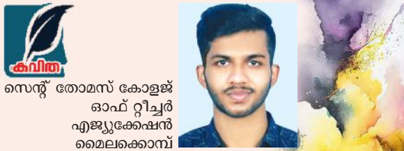
സെന്റ് തോമസ് കോളജ് ഓഫ് റീച്ചർ എജ്യൂക്കേഷൻ മൈലക്കോമ്പ്

വീട്ടിൽ ചെന്നു കഴിഞ്ഞപ്പോഴേക്കും ബാക്കി ചേട്ടന്റെ അവതരണം. “അമ്മേ ഇവളെ കള്ളിയാണമ്മേ. ഇവളുടെ സഞ്ചിയിൽ റീച്ചറിന്റെ കളിപ്പാട്ടം ഉണ്ടായിരുന്നു. റീച്ചറാ പറഞ്ഞ ഇവളെ കള്ളിപ്പാട്ടം കട്ടെടുത്തു