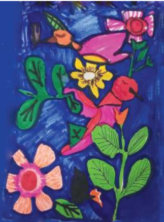
എന്റെ വരും യാന സി. ബി. ക്ലാസ് VI ശരിമ വിദ്യാവിഹാർ സ്കൂൾ ഇൻഡോർ

അങ്കണത്തെമാവിൽനിന്നും- ദൂതെപ്പഴം വീഴ്കെ അമ്മതൻ കണ്ണിൽനിന്നും- തിർന്നു ചുടുകണ്ണീർ അങ്കണമെവിടെയാണെൻ കവീ? തൈമാവറുത്തതാണീക്കസേര അമ്മതൻ കണ്ണിലെ കണ്ണീർ ഉണ്ണി കോലിട്ടു കുത്തിയതാവാം പറയുവാനാണു നീയെന്നു ചോദിച്ചാൽ മനസ്സില്ലെന്നിരിക്കു പറയുവാൻ നിന്നോട് മനസ്സിലാക്കാൻ നിനക്കുമാവില്ല കവിയോണു ഞാനെന്നു പറഞ്ഞാൽ തവിയാണു നിനക്കെന്നു പറയും നടിയാണു ഞാനെന്നുരഞ്ഞാൽ വടിയെടുത്തെന്നയടിച്ചിടും ആണാണു ഞാനെന്നു ചൊന്നപ്പോൾ പെണ്ണാണു ഞാനെന്നു നീ ചൊന്നു ആണല്ല ഞാനെന്നലറുകിൽ ആണെന്നു നീയലറുന്നു. അങ്കണത്തെമാവുകളെല്ലാം വാട്സാപ്പ് വനങ്ങളായി പഴംവേണ്ട ഉണ്ണികളെല്ലാം പഴംവീഴ്കുകളുമായി മരംകേറികളാണെല്ലാവരുമെങ്കിലും മരംകേറാനാർക്കുമറിയില്ല. തലതെറിച്ചവരാണെല്ലാവരുമെങ്കിലും തലയിലാർക്കുമാൾത്താമസമില്ല ഞാനാണെന്നു ഞാൻ പറഞ്ഞാലും ഞാനാണെന്നു നീ തീരുമാനിക്കും പറയാതെ പറഞ്ഞാവാൻകൊല്ലാം പറപോലെ നീയെടുത്തു വിറ്റില്ലയോ. ഇവിടെയെന്നിരിക്കില്ല ഞാനെന്ന സ്വത്വം ഇവിടെ നിനക്കില്ല നീയെന്ന സ്വത്വം അവരുമെങ്ങും നീയാരാണ് അവരുമെങ്ങും ഞാനാണെന്ന്. പ്രിയപ്പെട്ടൊരൻ കവീ തൈമാങ്ങയൊന്നെന്നിരിക്കു തരുമോ? കണ്ണുനീരിൽ വിഷം ചേർത്തു കഴിക്കാൻ ഇവിടെ കണ്ണുനീർപോലും കള്ളം. ആരാണു നീയെന്നു ചോദിക്കാൻ നീയാരാണെന്നു പറയുക ആരാണു ഞാനെന്നു ഞാൻ തീരുമാനിക്കുന്ന നാൾ വരും വരും... വരാതിരിക്കില്ല!